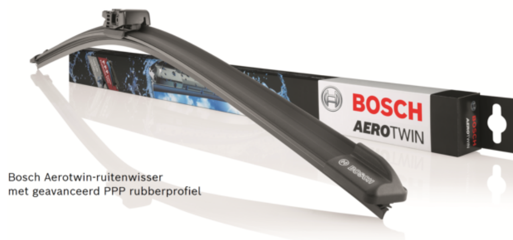
Bosch Aerotwin-ruitenwisser met geavanceerd PPP rubberprofiel

Een nieuwe rubber-samenstelling voor ruitenwissers die nog beter bestand zijn tegen slijtage.