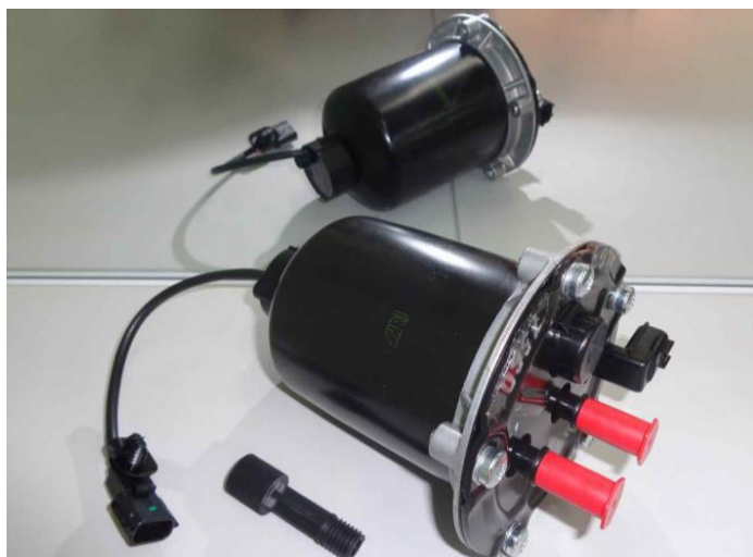
3. Plaats het filter in de behuizing, vergrendel het apparaat en sluit de sensor aan