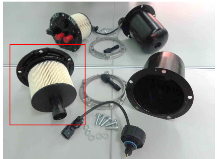
2. Montage van het Bosch-filter en de nieuwe pakking op het deksel