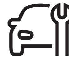
Сервиз KTS 560 или KTS 590