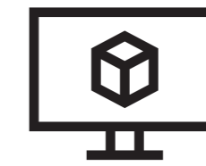
PC платформа DCU 220