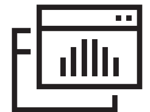
Производители на автомобили OE портали