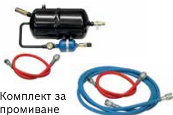
Комплект за промиване

Не на последно място, промиването е задължително, за да се запази ефективността на гаранцията на производителя и да се предотврати повреда на новия компресор от стружки и остатъци в охладителната верига. Това важи и за свръхзаредените системи. Охлаждащите им характеристики намаляват поради излишъка от масло, възпрепятстващ протичането на хладилния агент.