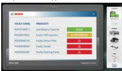
Кодовете за грешки на виртуалния DCU 220

Участниците печелят точки, които могат да споделят в социалните медии. Пет от участниците печелят точки, които могат да споделят в социалните медии.