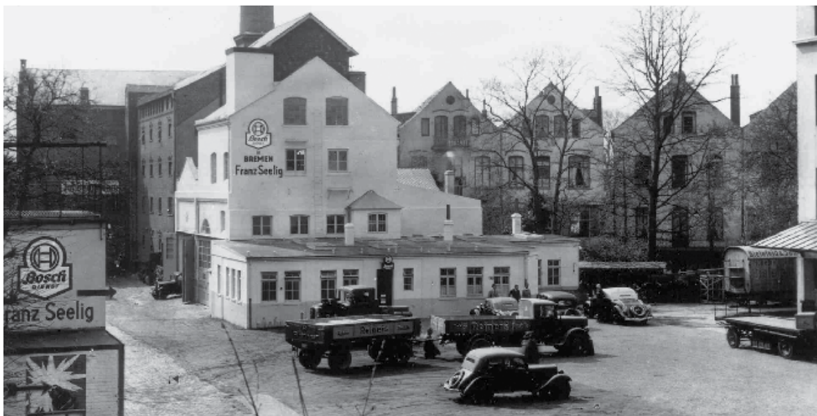
1939: Bosch Service Seelig в Бремен, Германия

Роберт Бош бързо вижда необходимостта от сервизна мрежа. През 1921 г. първият му сервизен партньор става автомобилната работилница Макс Айзенман в Хамбург - първият от многото, които ще последват. В момента Bosch Service е една от най-големите вериги от независими автосервизи в света, включваща над 17 000 партньори в 150 държави.