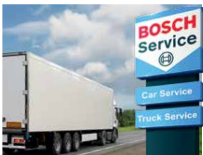
Bosch Service with Truck Service

Вече 100 години Bosch Service подкрепя партньорските си сервизи с резервни части, сервизно оборудване и бизнес и техническо нощу.