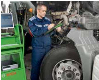
Скъпи фенове на камионите,

Модерните камиони са шедеври на високотехнологичния инженеринг. Ето защо сервизите се нуждаят от съвременно оборудване за тяхната поддръжка и ремонт.