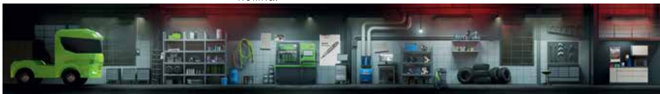
Пълна панорама на сервиза в играта Bosch Truck Escape