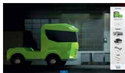
Избор на инструменти от плъзгащото се меню

Denoxtronic filters and a starter through to the installation of diesel injectors and a steering pump.