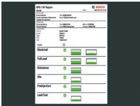
Протоколът показва резултати от всеки тест