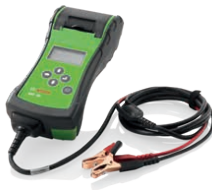
BAT 131 (s integrovanou tiskárnou) ☎ 0 684 400 731

Optimální pro testování startovacích akumulátorů s napětím 6 V a 12 V (olovené s elektrolytem, gelové a vlietové akumulátory/AGM). Bezzátěžový testovací postup vede k rychlým, přesným a spolehlivým výsledkům měření.