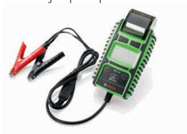
BAT 115 (s integrovanou tiskárnou) ☎ 0 687 000 115

Snadné testování 6V a 12V startovacích akumulátorů. Pro olovené akumulátory s elektrolytem, akumulátory EFB, gelové a také AGM akumulátory (ploché a spirálové). Kromě toho lze testovat také nabíjecí systémy s napětím 12 V a 24 V.