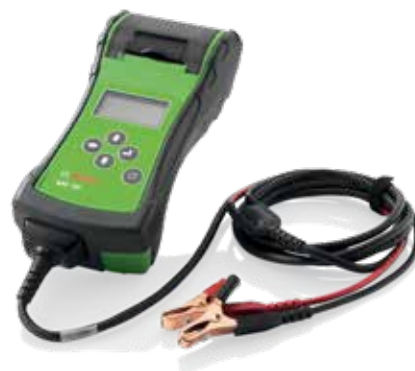
BAT 131 (mit integriertem Drucker) ☎ 0 684 400 731

Optimal zum Testen von 6-V- und 12-V-Starter-Batterien (Blei-Säure-, Gel- und Vlies-Batterien/AGM). Der nicht belastende Testablauf führt zu schnellen, präzisen und verlässlichen Messergebnissen.