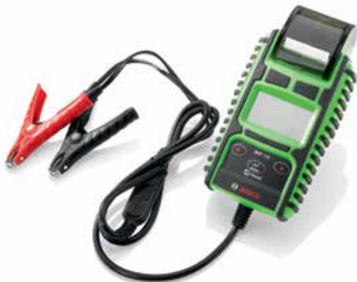
BAT 115 (mit integriertem Drucker) ☎ 0 687 000 115

Einfaches Testen von 6-V- und 12-V-Starter-Batterien. Sowohl Blei-Säure-, EFB-, Gel- als auch AGM-Batterien (flach und spiral). Außerdem lassen sich 12-V- und 24-V-Ladesysteme prüfen.