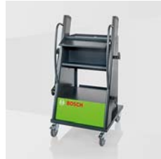
Abbildung enthält Zubehör