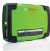
KTS 560 – Steuergerätediagnose mit 1-Kanal-Multimeter