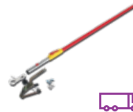
Spannvorrichtung mit Teleskopstab für BEA 070 (für Nfz mit Hochauspuff)