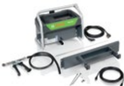
Diesel-Nachrüstset für FSA 740