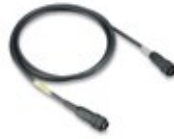
Anschlussleitung BEA 040 zu BEA 030 und zu BEA 060