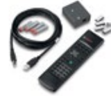
Fernbedienung Sender und Empfänger