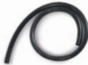
Entnahmeschlauch (BEA 070) für Nfz-Entnahmesonde (1 m)