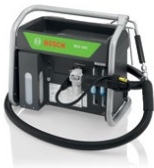
Erweiterbar mit dem BEA 090 Messmodul zur Partikelzählung

Dank der robusten Bauweise bewährt sich die BEA 950 Serie spielend im rauen Werkstattalltag.