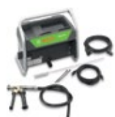
Diesel-Nachrüstset für BEA 750 Benzin und BEA 550 Benzin