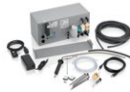
Hochrüstkit zur 4-Gasmessung, für FSA 740