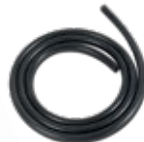
Entnahmeschlauch (BEA 070) für Nfz-Entnahmesonde (3,5 m)