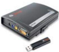
KTS 515 – OBD-Modul