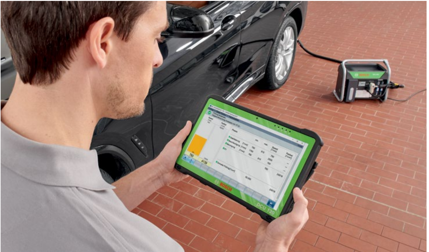
BEA 090 wird anhand der DCU 120 gesteuert