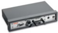
Drehzahlmessmodul BEA 040