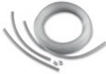
Nachrüstset Silikonschlauch für 2-Takt-Motoren