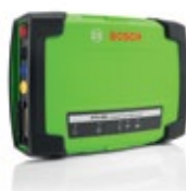
KTS 590 – Steuergerätediagnose mit 2-Kanal-Multimeter/ 2-Kanal-Oszilloskop