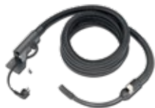
Beheizter Entnahme- schlauch (BEA 070) für Nfz-Sonde (5 m)