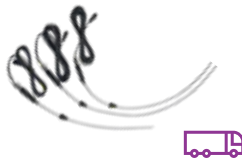
Messsonden zur Temperaturmessung