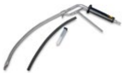
Abgassonde Pkw Benzin (Teillast bis 500°C)