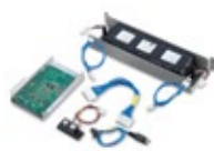
Akku-Nachrüstset für BEA 070