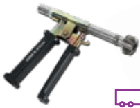
Nfz-Entnahmesonde für BEA 070