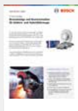
Product Spotlight Bremsbeläge und Brems Scheiben für EV/HEV 1 987 710 530