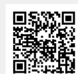
Bosch Bremse: Sicher von Anfang an