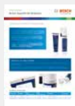
Product Spotlight Bosch Superfit für Bremsen 1 987 710 558