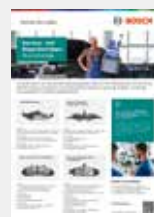
Poster Service- und Reparaturtipps Bremsbeläge