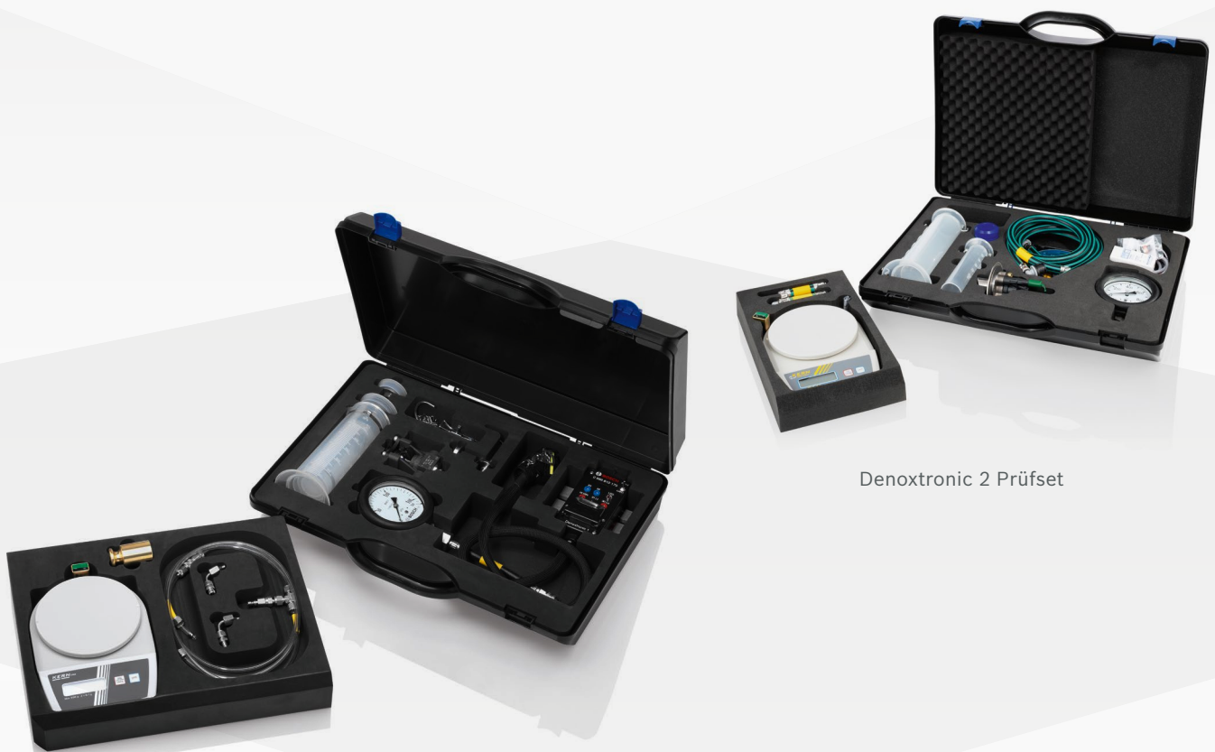
Denoxtronic 2 Prüfset

Mit den Denoxtronic Prüfsets und einem KTS Truck werden die Komponenten des Abgasnachbehandlungssystems Denoxtronic von Bosch in eingebautem Zustand direkt am LKW getestet. Dank der eindeutigen Identifizierung der defekten Komponente kann schnell eine passende Lösung gefunden werden.