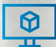
PC-Plattform DCU 220