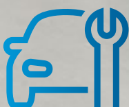
Werkstatt KTS 560/590