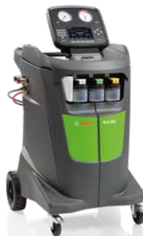
BOSCH ACS 863

Gültig auch für das baugleiche Klimaservicegerät von Robinair.