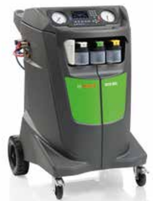
BOSCH ACS 663-Ri

Gültig auch für das baugleiche Klimaservicegerät von Robinair.