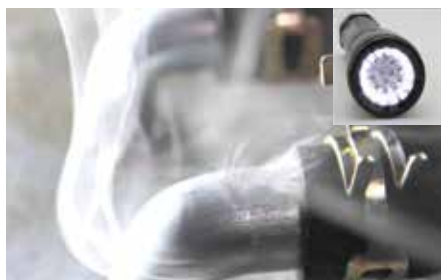
Dampe kan identificeres under hvidt lys.

Der kan også fås en 7 bar kvælstof-regulator til brug sammen med store kvælstofflasker i værksteder. Hertil kræves en cylinderslange (som kan leveres separat) til tilslutning til SMT 300.