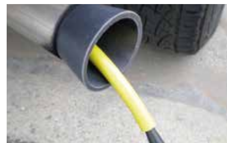
Leakfinder kan også finde utætheder i udstødningssystemer.