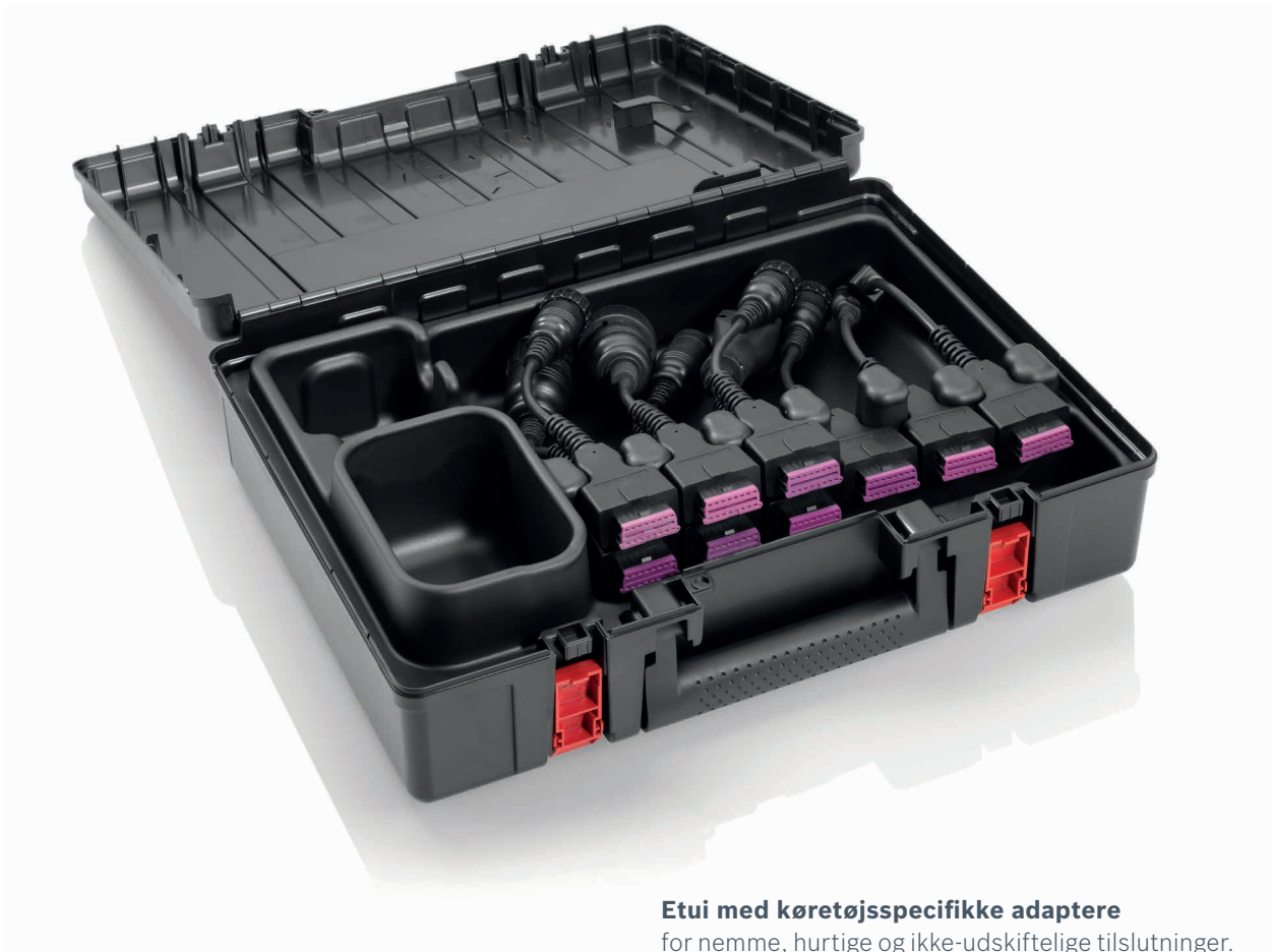
Etui med køretøjsspecifikke adaptore for nemme, hurtige og ikke-udskiftelige tilslutninger.

"Easy Connect" forsimples i høj grad forbindelsen mellem KTS Truck-diagnosticeringsmodulet og køretøjet. KTS Truck kan tilsluttes OBD-stikket direkte via "Easy Connect". Takket være køretøjsspecifikke adapterlinjer kan enheden tilsluttes køretøjer uden OBD-diagnosestik lige så let. Adapterne er ikke udskiftelige for at øge effektiviteten. Adaptere udvikles yderligere i overensstemmelse med de køretøjer, der er dækket af diagnosticeringssoftwaren. Takket være det modulære "Easy Connect"-koncept gøres værksteder fremtidsparate.