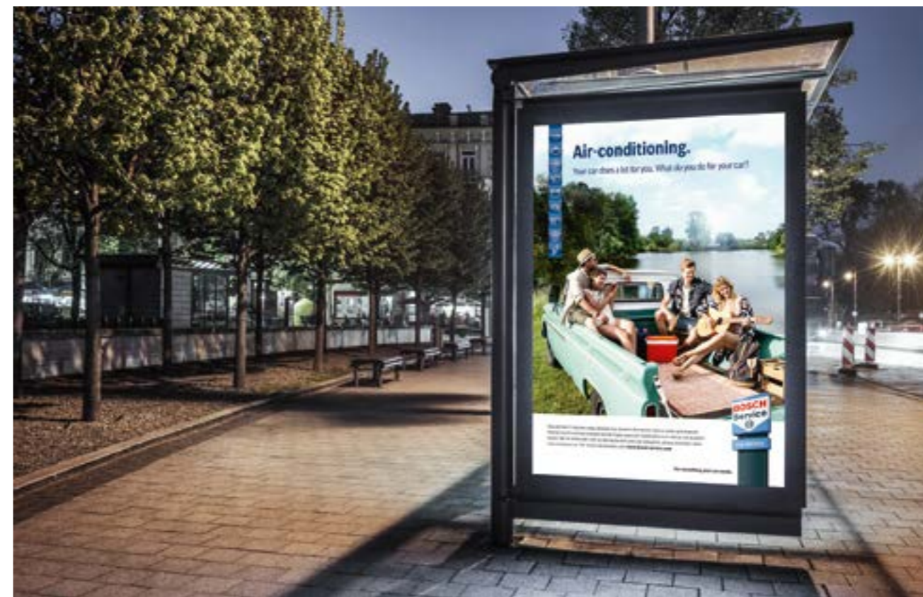
øjnefaldende udendørs medier til taktiske kampagner i dit lokalområde.

Derudover stiller vi specialudviklede skabeloner til rådighed for at bakke op om dine egne lokale markedsføringsaktiviteter til både private- og erhvervskunder.