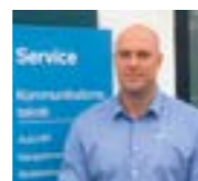
Christian Buhelt AutoCenter København, Danmark

» Det er vigtigt for mig at indgå i et koncept med et stærkt brand, der fokuserer på kvalitet.»