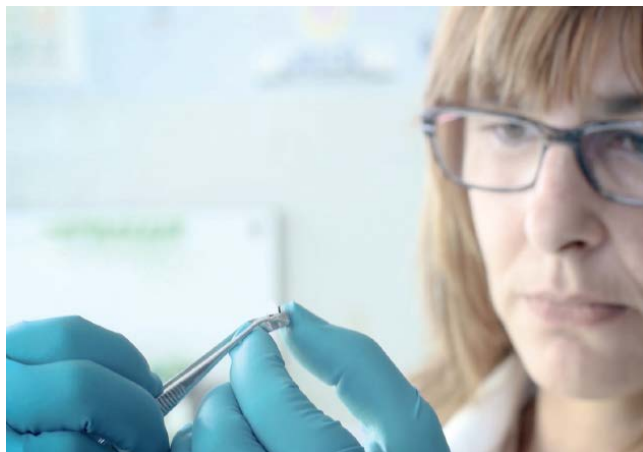
Bosch udvikler forrudeviskere i Bühl (Tyskland) og Tienen (Belgien)