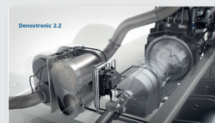
Animación sobre los filtros Denoxtronic para camiones