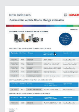
Ampliaciones de gamas: información de producto