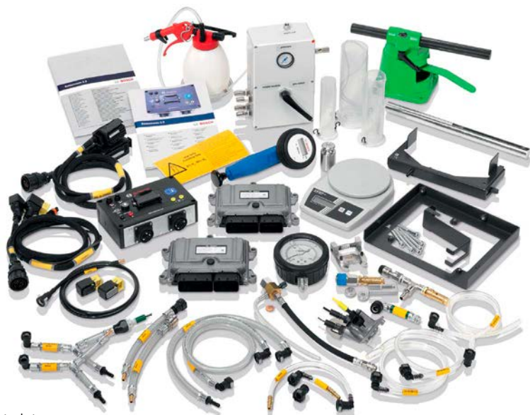
Komplet alata Denoxtronic 2.2

Diljem svijeta upotrebljava se oko 18 milijuna sustava Denoxtronic – u kamionima, građevinskim i poljoprivrednim strojevima kao i u stacionarnim instalacijama s dizelskim generatorima. Zbog njihove velike kilometraže potreba za servisiranjem i potražnja za isplativim popravcima sustava Denoxtronic sve je veća. Ti sustavi, koji upotrebljavaju Adblue za pretvaranje štetnih dušikovih oksida (NOx), važne su komponente obrade ispušnih plinova zbog sve strožih emisijskih normi.