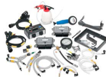
Komplet za nadogradnju sustava Denoxtronic 2.1 na inačicu 2.2

Ovisno o starosti gospodarskog vozila u obzir dolazi još jedno isplativo rješenje – uklanjanje i popravak neispravnih modula za napajanje sustava Denoxtronic. Bosch u tu svrhu nudi komplet alata Denoxtronic 2.2 i komplet za nadogradnju sustava Denoxtronic 2.1 na inačicu 2.2. Sva funkcionalna ispitivanja mogu se izvesti na uklonjenim komponentama s pomoću posebnih alata uključujući Boschovu dijagnostičku opremu kao što je KTS 560/590 i komplet alata. Upute za dijagnostiku i popravak uključene u ESI[tronic] Evolution pružaju potrebne podatke za tu svrhu.