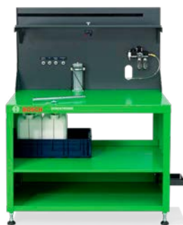
Bosch radni stol za Denoxtronic za sve poslove održavanja sustava Denoxtronic