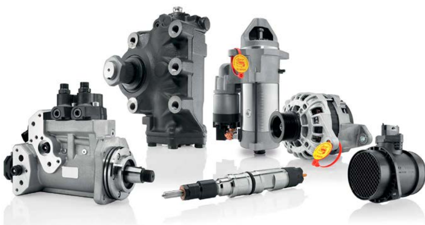
Odabrani Boschevi dijelovi za gospodarska vozila dostupni su i kao dijelovi programa Bosch eXchange.

Za radionice za gospodarska vozila postaje sve važnije uzeti u obzir starost vozila, a time i njegovu poštnu vrijednost u odnosu na njegovu namjenu u voznom parku kupca u cjelini. U programu Bosch eXchange nudi se širok asortiman zamjenskih dijelova za popravak gospodarskih vozila u skladu s njihovom trenutnom vrijednošću. To pomaže radionicama gospodarskih vozila da zadovolje zahtjeve svojih kupaca za visokokvalitetnim popravcima vozila temeljenima na vrijednosti. Peter Lukassen, odgovoran za operativnu održivost u Boschevu Odjelu mobilnosti i autoopreme, odgovara na pitanja o strategiji održivosti programa Bosch eXchange.