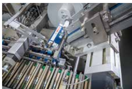
A menetet védő cső felhelyezése