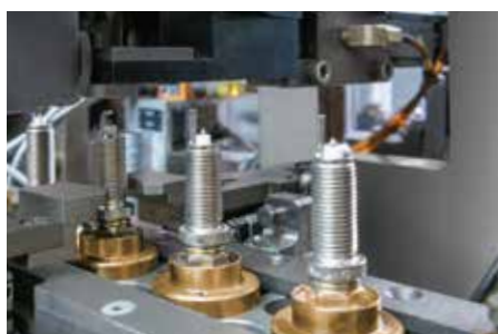
A gyertya hézag előbeállítás

Az előre beállított gyertya hézag további szállítás során történő védelme érdekében a gyújtógyertya menetére védőcsövet helyeznek. A gyújtógyertyákat ezután a csomagológépbe továbbítják, és egyenként csomagolják. Ezután a csomagokba 4 vagy 10 db gyújtógyertyát csomagolunk. Mielőtt a Bosch gyújtógyertyák végleg elhagyják a gyárat, azelőtt még speciálisan képzett alkalmazottak rendszeres minőségellenőrzésén esnek át. Így a műhelyek bízhatnak a Bosch gyújtógyertyák kiváló minőségében, megbízhatóságában és teljesítményében.