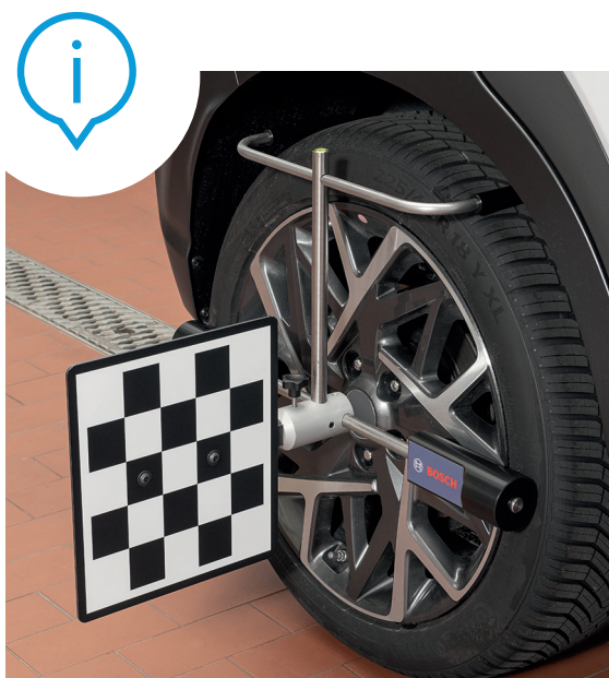
Uchwyt na koło Bosch 1 szt. (CTA 100-1 / 1 688 120 190)