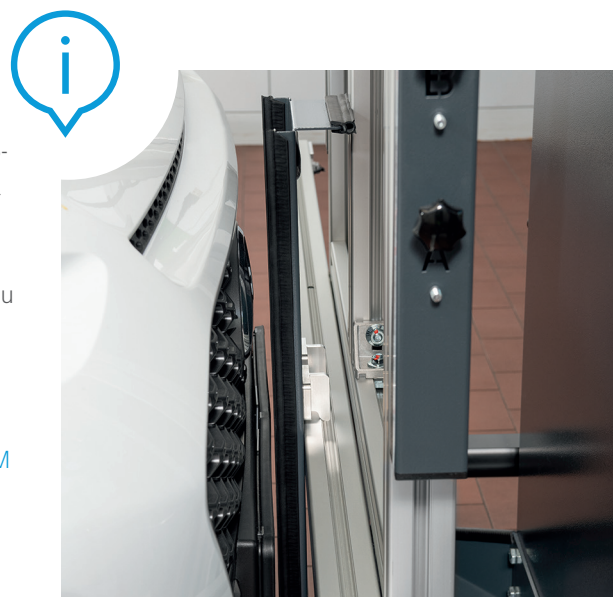
Tablica kontaktowa (CTA 104-1 / 1 681 320 090)