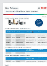
Extensões da gama: informação de produto