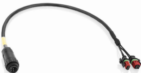
Adapterski kabl za testiranje Delphi Euro 6 injektora

Ispitni stolovi su standardno opremljeni CRI priborom za magnetne i piezo common-rail injektore. Asortiman uključuje modularne komplete za nadogradnju za Bosch komercijalna vozila i off-highway