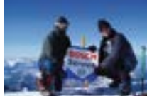
2009: Bosch Car Service når toppen – medlemmar i det spanska teamet bestiger toppen på Mont Blanc, 4 808 meter över havet