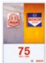
1996: 75 år med Bosch Service