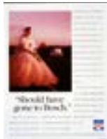
1994: Bosch Service-annons, Sydafrika