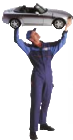
2001: Bosch Car Service annonsering