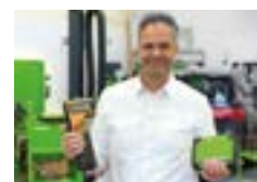
2018: 30 år med Bosch KTS diagnostiktestare