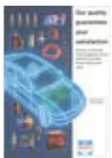
1996: Bosch Service Kvalitetskampanj