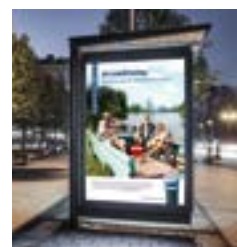
2017: Kommunikationskampanj: "Vad gör du för din bil?"