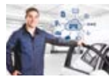
2016: Automechanika: Bosch presenterar smarta lösningar för framtidens verkstäder