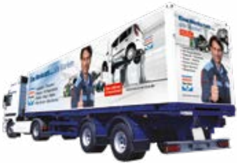
2010: Bosch Car Service lastbilskampanj