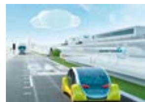
2018: Bosch etablerar en avdelning för uppkopplade mobilitetstjänster