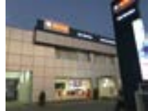
2017: Bosch inviger företagsägda, företagsdrivna Bosch Car Service i Bangalore, Indien