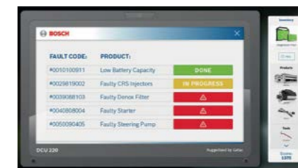
Коди помилок - відображаються на віртуальному DCU 220

пропонується виконати різноманітні завдання з технічного обслуговування та ремонту. Гравці отримують бали, якими вони можуть поділитися у соцмережі.