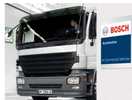
Модульна концепція Bosch для комерційних ТРАНСПОРТНИХ ЗАСОБІВ

Bosch надає необхідну підтримку СТО комерційного автотранспорту, які бажають скористатися глибокими знаннями та досвідом Bosch у сфері діагностичного обладнання та широким асортиментом запчастин. Завдяки модульній концепції Bosch для комерційних транспортних засобів партнери можуть скористатися перевагами діагностичного обладнання Bosch, програмного забезпечення для СТО ES[tronic] 2.0 Online, запчастинами та широким асортиментом навчань. Привабливі вивіски та широкий маркетинговий і рекламний пакет забезпечують додаткову ефективну презентацію зовнішнього виду СТО.