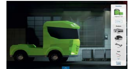
Меню у вигляді панелі інструментів

Гра розпочинається коротким жартиливим роликом: водій вантажівки везе повний кузов бананів, коли раптом мавпа, яка втекла з зоопарку, опиняється на дорозі та вкрай спантеличує його. Результат: пошкоджена вантажівка, якій потрібно заїхати на СТО. Як тільки учасники вмикають освітлення на СТО, гра починається.