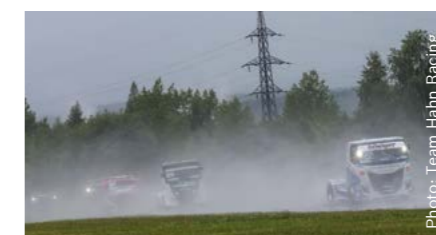
Лукас Ган візьме участь у двох перегонах у 2021 році

Після чотирьох так званих Digital ETRC Racing Challenges, тобто віртуальних перегонів на вантажівках, сезон ETRC 2021 розпочнеться 22 травня. Перші реальні перегони відбудуться в Італії на міжнародному автодромі Мізано. В цьому сезоні вантажівки для перегонів вперше працюватимуть на гідратованому біопаливі (HVO). Відповідно до проведених досліджень це синтетичне паливо дозволяє зменшити утворення окалини, скоротити обсяги парникових газів, оксиду азоту та викидів дрібного пилу порівняно зі згоранням традиційних видів дизельного пального у