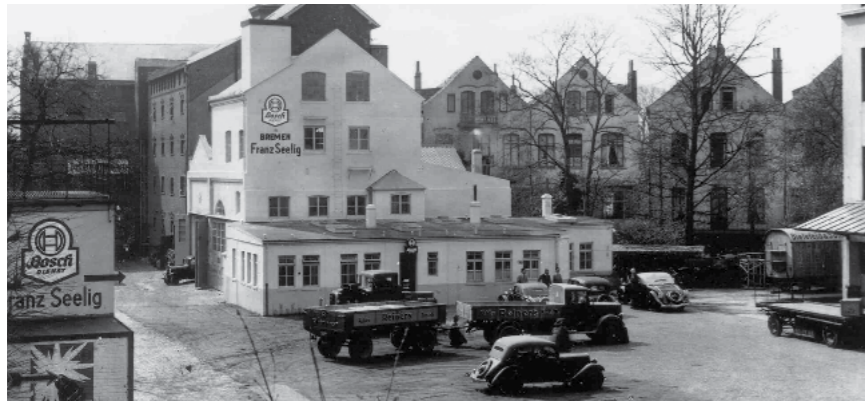
1939 рік: Bosch Service Seelig, м. Бремен, Німеччина

Robert Bosch визнали необхідність створення сервісної мережі на ранньому етапі свого існування. У 1921 році першим партнером у сфері сервісного обслуговування стала автомобільна майстерня Mas Eisenmann у м. Гамбург – перша з багатьох, які приєдналися пізніше. На сьогодні, Bosch Service є однією з найбільших у світі сервісних мереж, незалежно від бренду, включаючи понад 15000 СТО у 150 країнах.