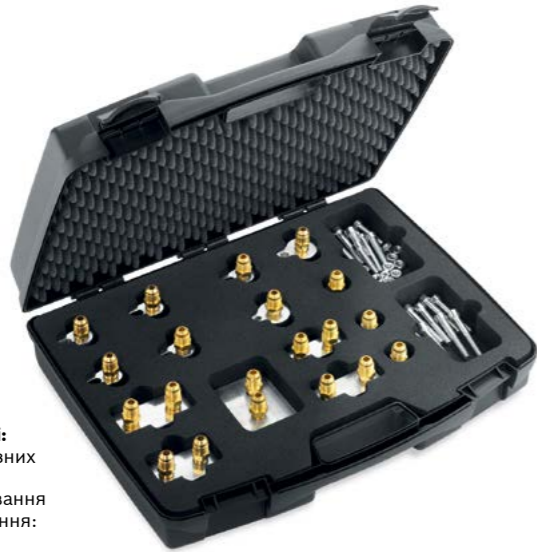
У практичній валізі: 15 адаптерів для різних автомобільних систем кондиціонування Номер для замовлення: S P00 101 974

Зниження продуктивності систем кондиціонування зазвичай спричиняється забрудненнями внаслідок тертя та появи стружки. Це може навіть спричинити дефекти компресора. Ретельне очищення є чудовим рішенням для видалення залишків холодильного мастила та забруднень з контуру циркуляції холодоагенту. У той же час це дозволяє захистити всі компоненти системи кондиціонування від можливих пошкоджень. Промивання кондиціонера також ре-