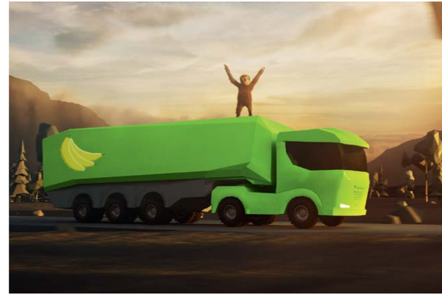
Bosch Truck Escape

Операція Bosch з порятунку вантажівки – це онлайн гра, розроблена для СТО комерційних транспортних засобів, яка розповідає про наявний широкий асортимент обладнання та запчастин у ігровій формі.