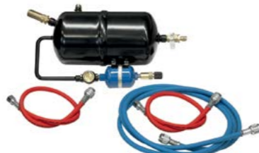
Комплект для промивання.

комендується при заміні такого компонента системи, як компресор. Зокрема, промивання є обов'язковим для збереження гарантії виробника та запобігання пошкодженню нового компресора стружкою та залишками холодоагенту в контурі. Це також стосується перевантажених систем. Їхня ефективність охолодження знижується через надлишки оливи, що перешкоджають потоку холодоагенту.