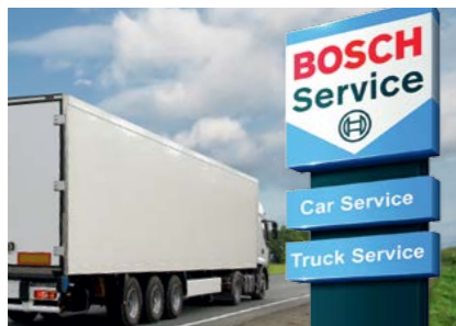
Bosch Service та Truck Service

Відповідаючи вимогам необхідного простору, понад 70 СТО у Німеччині