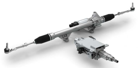
Steer-by-Wire-Lenksystem von Bosch

Sukzessive werden dann auch die Bedarfe für den Aftermarket entstehen. Bosch achtet deshalb schon während der frühen Entwicklungsphase darauf, die zuverlässige Versorgung der Werkstätten mit qualitativ hochwertigen Ersatzteilen sicherzustellen.