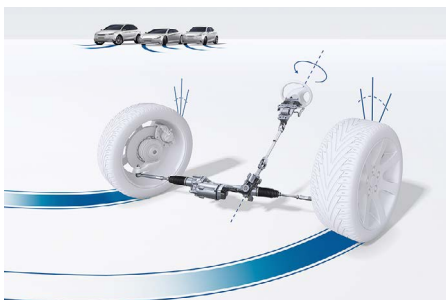
Elektrische Lenksysteme von Bosch – unabhängig vom Antriebskonzept des Fahrzeugs

Die EPS-Lenkung mit Fail-operational-Funktion ist, wie alle Elektrolenkungen, mit einem Drehmomentsensor bestückt, der das Lenksignal erfasst und zur Berechnung der optimalen Lenkunterstützung an ein Steuergerät sendet. Der Elektromotor stellt daraufhin die nötige Lenkkräft bereit. Dadurch wird das Fahren nicht nur komfortabler. In dieser fehlertoleranten (engl. fail-operational) Ausführung sind die Stromversorgung, die Elektronikkreise, das Steuergerät und die Teilmaschinen in der Servoeinheit doppelt verbaut. Fällt eine der