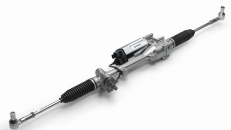
Bosch EPSapa mit Fail-operational-Funktion

Mit ihrer elektronischen Schnittstelle ermöglichen elektrische Lenkungen von Bosch bereits heute automatisiertes Fahren bis zu SAE-Level 4. Neben komplexer Software und der Vernetzung von unterschiedlichen Fahrzeugkomponenten wie Antrieb, Bremse und Lenkung ist die Redundanz sicherheitsrelevanter Funktionen eine Voraussetzung für höhere Automatisierungslevel.