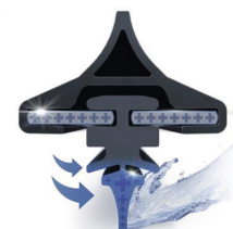
Longlife-Wischgummi-Profil für weniger Verschmutzung, Abrieb und Verschleiß