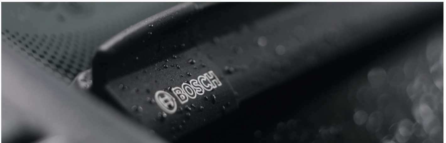
Robust, leistungsfähig und langlebig: Aerotwin Scheibenwischer

Kaum beachtet, aber essenziell für eine sichere Fahrt: Hinter modernen Bosch Scheibenwischern mit der Wischgummi-Technologie Power Protection Plus und der Longlife-Formel steckt einiges an Know-How.