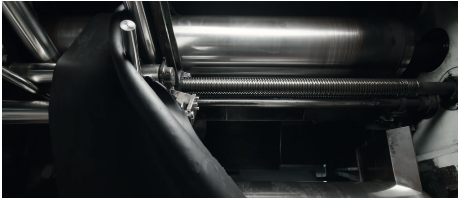
Das verwendete Wischgummi basiert auf einer Bosch-eigenen Spezialmischung

dass auf weitere Zusätze wie Alterungsschutzmittel, die häufig einen schmierigen Film auf der Scheibe hinterlassen, verzichtet werden kann.