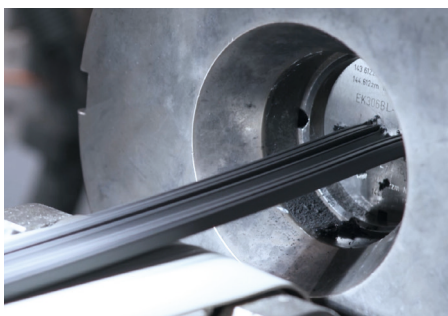
Beim Extrusionsverfahren werden verschiedene Gummistoffe für Wischlippe und Gummirücken zusammengefügt

Früher wurde das Wischgummi aus einem einzigen Gummistoff hergestellt und wie beim Waffelbacken in eine Form gepresst. Modernste Technologien bei Bosch nutzen heute das sogenannte Extrusionsverfahren. Dabei werden zwei unterschiedliche Gummimaterialien unter Druck aus einer formgebenden Öffnung gepresst. Die Wischlippe, die direkten Kontakt zur Windschutzscheibe hat, ist besonders verschleißfest und besteht aus einem festen Material. Der Wischgummirücken hingegen besteht aus einem weicherem Material, so dass der Wischer beim Richtungswechsel flexibel und ohne Geräusche umklappen kann.